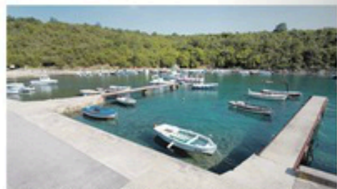
Za ozbiljnije investicije Vela Jana – nesporna