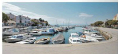
Luku Malinska čekaju veliki zahvati